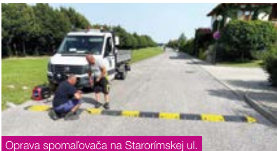
Oprava spomaľovača na Starorímskej ul.