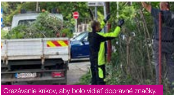
Orezávanie kríkov, aby bolo vidieť dopravné značky.