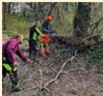
Odstránenie nebezpečných konárov v lese.