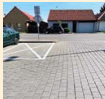
Striekacie čiar na parkovisku kvôli bezpečnosti pri vychádzaní z parkoviska.