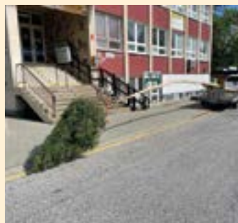
Preprava symbolického stromu – májky.