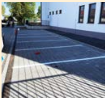
Inštalovanie tabúl a striekanie čiar na novom parkovisku na Kováčsovej ulici.

Z množstva pracovných činností zrealizovaných v uplynulom období vyberáme nasledovné: