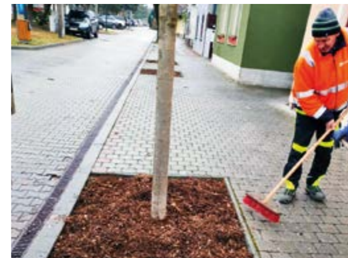
Pokračovali sme v podsype stromov so štiepkou.

Z množstva pracovných činností zrealizovaných v uplynulom období vyberáme nasledovné: