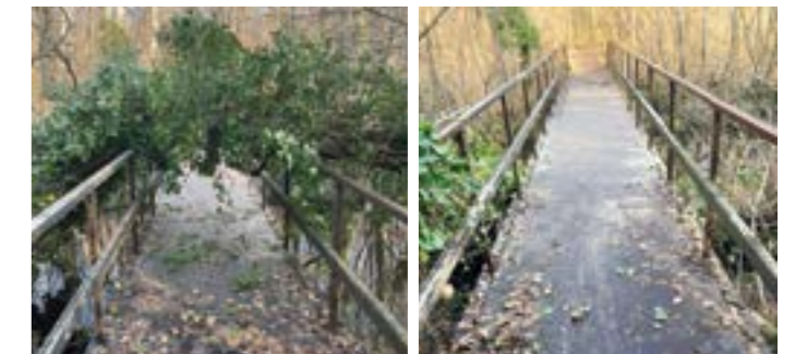
Odstraňovali sme padnuté stromy v lese.