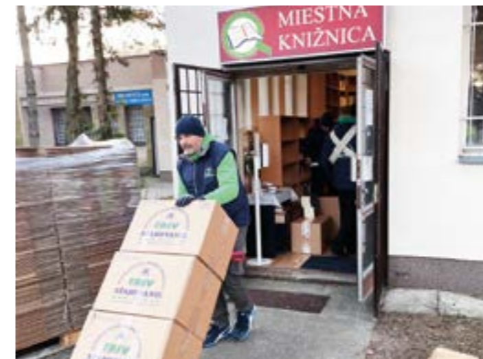
Vystažovali sme staré priestory knižnice, ktoré boli v budove zdravotného strediska.