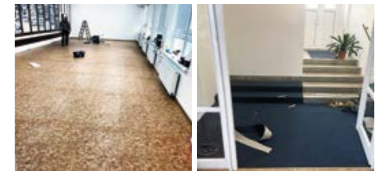
Pripravili sme nové priestory knižnice, na Balkánskej ulici, pod sídlom pošty.

Z množstva pracovných činností zrealizovaných v uplynulom období vyberáme nasledovné: