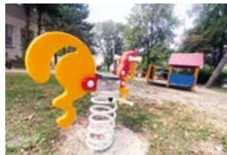
Zdravotné stredisko - osadenie nových prvkov.