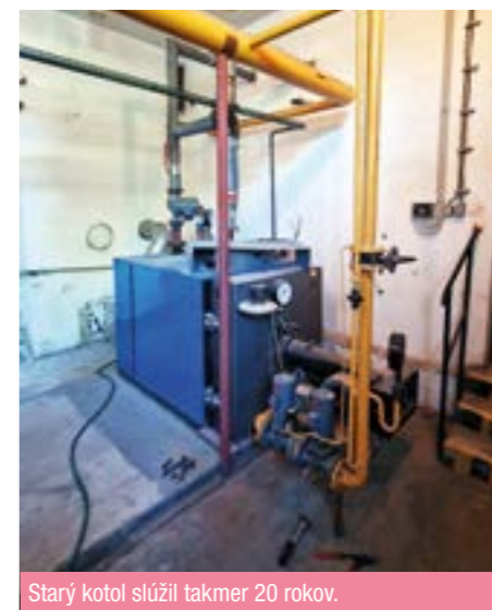
Starý kotol slúžil takmer 20 rokov.