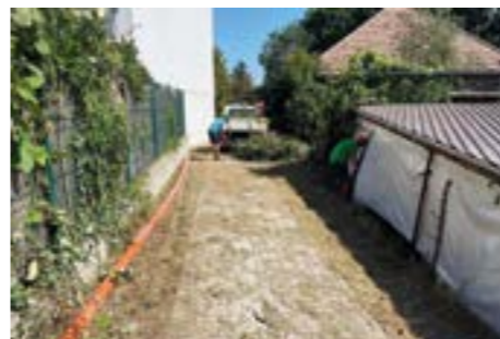
Hypokaust - vyčistenie pozemku.

Z množstva pracovných činností zrealizovaných v uplynulom období vyberáme nasledovné: