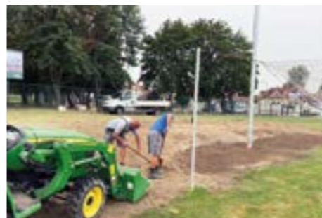
MFK - úprava terénu a pomocné práce.