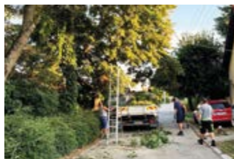
Orez stromov na Maďarskej ulici kvôli vozidlám OLO.