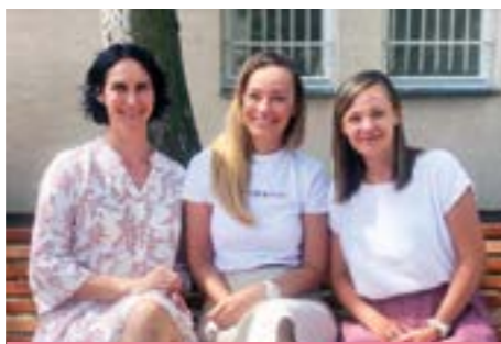
Naše tri nové pediatričky.

Popri tom sme tiež pracovali na novej det-