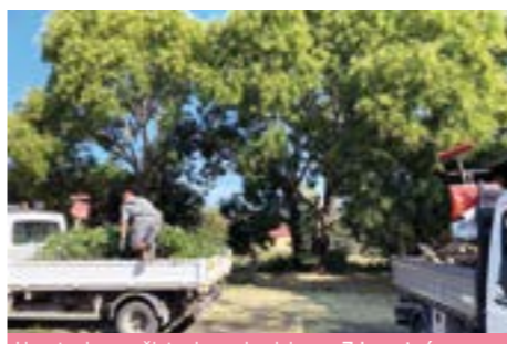
Upratovanie a vyčistenie parkoviska za Zdravotným strediskom.