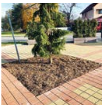
Oprava dlažby na námestí pred obchodom.

Z množstva pracovných činností zrealizovaných v uplynulom období vyberáme nasledovné: