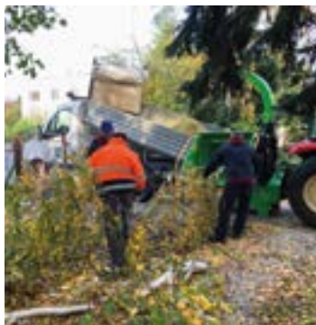
Čo sme si orezali, to sme zmulčovali a červienku zazimovali.