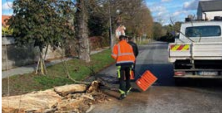
Aj toto je naša práca. Odstránenie spadnutého konára na ceste Gaštanová aleja.