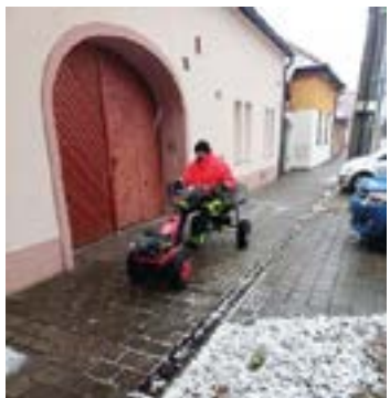
Zimnú údržbu zabezpečujeme vždy, keď je to potrebné.