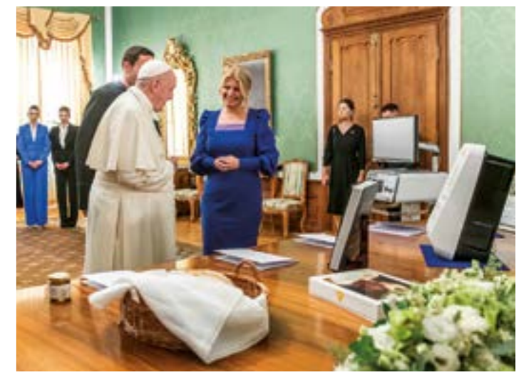
Prezidentka Zuzana Čaputová pri odovzdávaní knihy Svätému Otcovi Františkovi, 13. 9. 2021