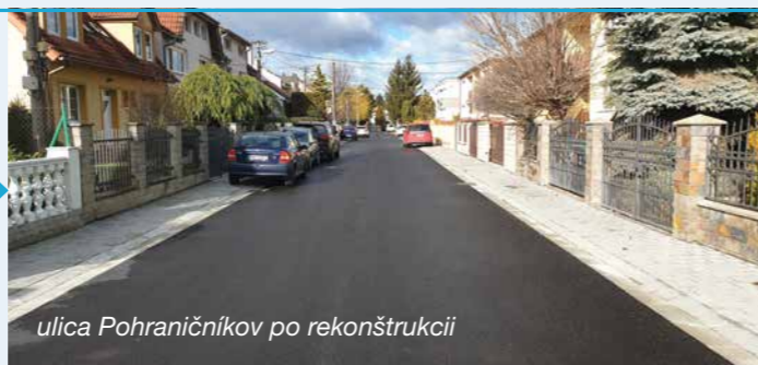
ulica Pohraničníkov po rekonštrukcii