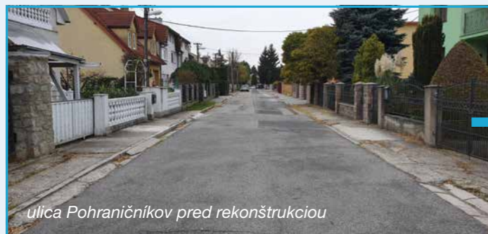
ulica Pohraničníkov pred rekonštrukciou