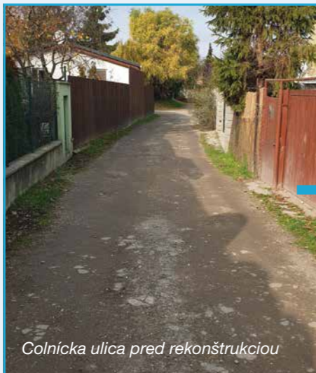
Colnícka ulica pred rekonštrukciou