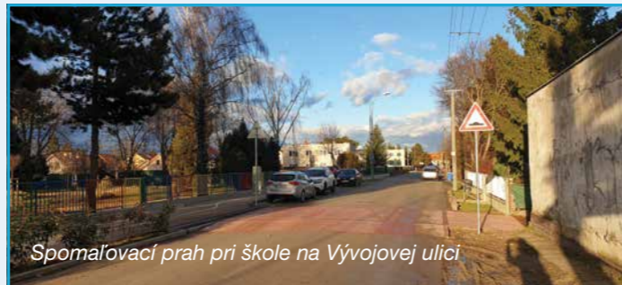
Spomaľovací prah pri škole na Vývojovej ulici

V decembrovom čísle Rusovských novín sme vás informovali o rekonštrukciách miestnych komunikácií v Rusovciach. Dnes vám prinášame fotodokumentáciu toho, čo sme si ako mestská časť mohli dovoliť aj vďaka tomu, že sa nám podarilo získať externý zdroj financovania novej školy a jedálne.