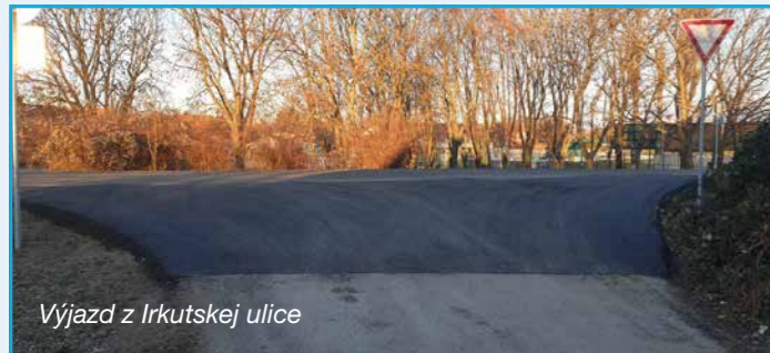
Výjazd z Irkutskej ulice