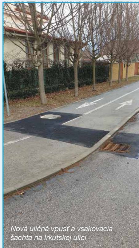
Nová uličná vpusť a vsakovacia šachta na Irkutskej ulici