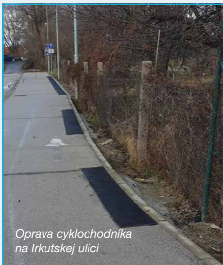
Oprava cyklochodníka na Irkutskej ulici