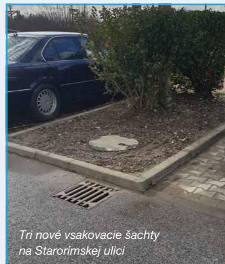
Tri nové vsakovacie šachty na Starorimskej ulici