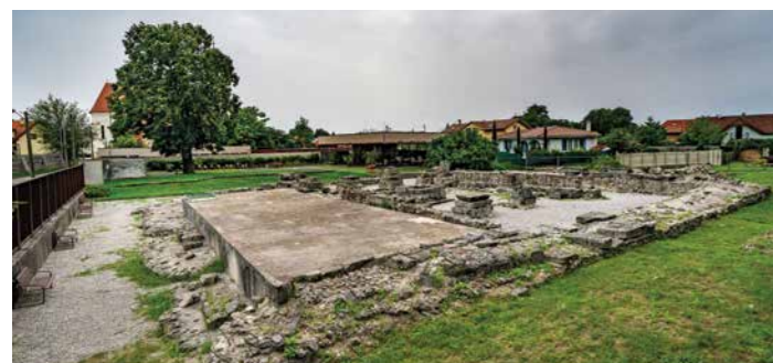
Múzeum antická Gerulata