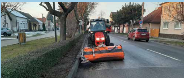
Dobré počasie priebežne využívame na strojové zemetanie komunikácií a čistenie uličných vpustí