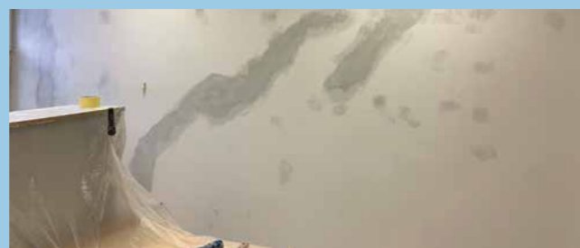
Vymaľovali sme kancelárske priestory na miestnom úrade – kolegovia si to po 13 rokoch určite zaslúžia