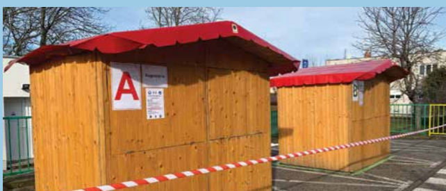
Asistovali sme pri príprave a realizácii skriningového testovania