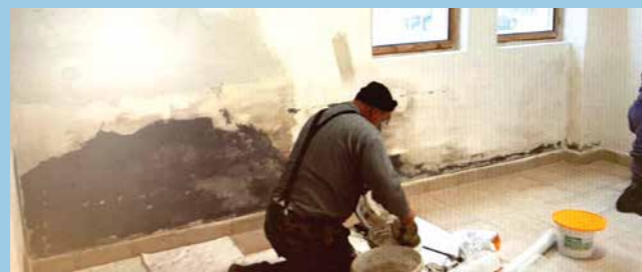
Priestor v zdravotnom stredisku sme vymaľovali a vytvorili zázemie pre mobilné odberové miesto na testovanie Rusovčanov na ochorenie COVID-19