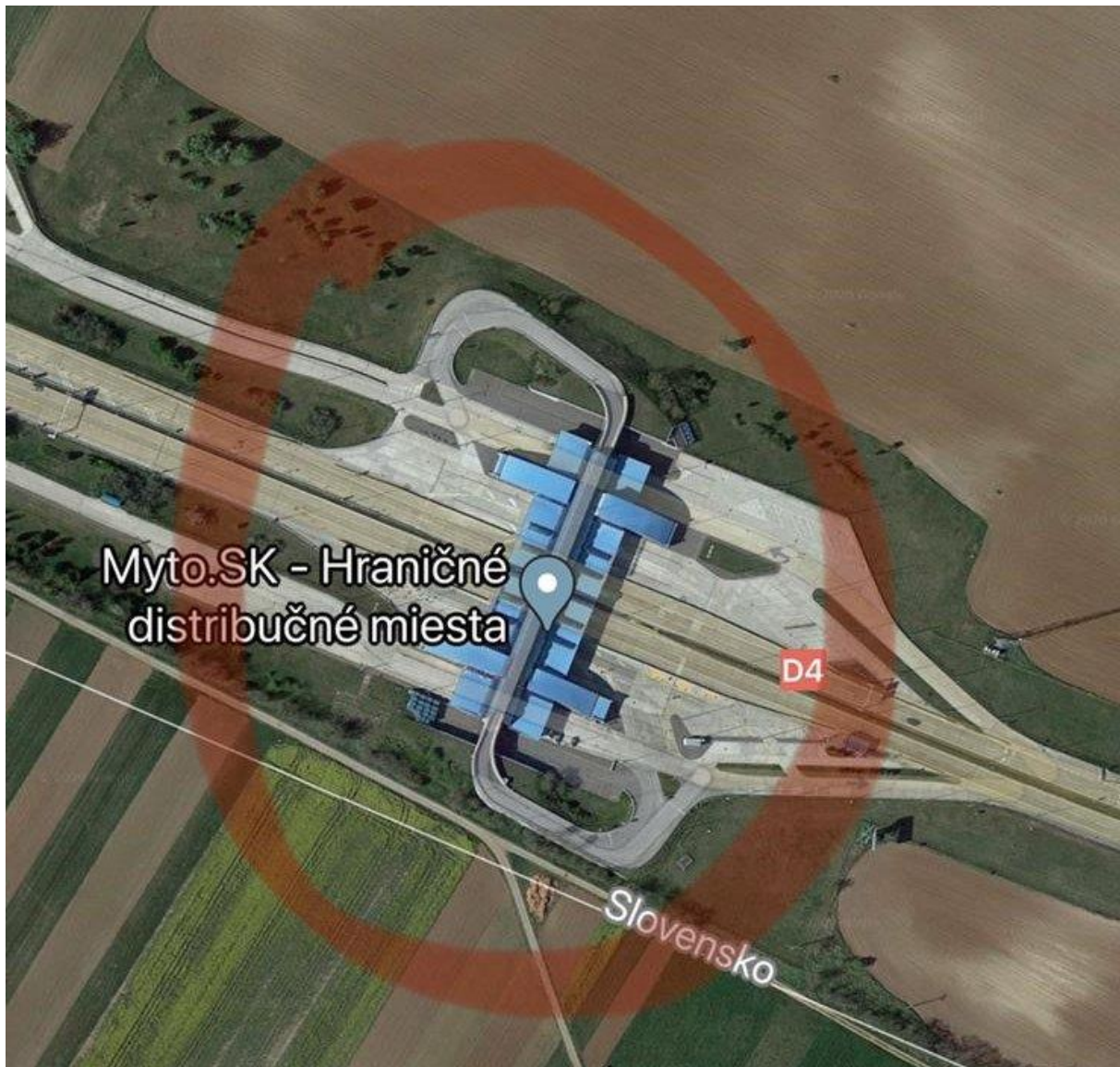
OBRÁZOK 2: OTOČKA NA DIAĽNIČNOM PRECHODE JAROVCE

Komisia preto navrhuje dôrazne žiadať staviteľa, aby buď dve nezávislé dopravné uzávery riešil tak, aby sa neudiali v tom istom čase, alebo vybavil druhé alternatívne spojenie Jaroviec s Bratislavou cez diaľničný hraničný prechod Jarovce-Kitsee, prípadne aby ako alternatívu vybudoval dočasný zjazd a výjazd z diaľnice D2 pri hranici s Maďarskom z cesty I/2 pre motorové vozidlá do 3,5 t s využitím mostného objektu pre poľnohospodárske účely ponad diaľnicu.