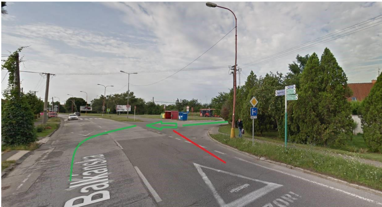
OBRÁZOK 1: NEPREHĽADNÝ VÝJAZD Z KOVÁCSOVEJ NA BALKÁNSKU, KDE AUTÁ POTREBUJÚCE ROZHĽAD (ZELENÁ) SA KRIŽUJÚ S AUTOBUSMI (ČERVENÁ)

Na MČ sa obrátila občianka s dvoma podnetmi: neprehľadný výjazd z ulice Kováčovej na Balkánsku na južnom konci Rusoviec a zlý stav príjazdovej ulice k zdravotnému stredisku (ul. Pohraničníkov). Oba problémy vizualizovala fotodokumentáciou: