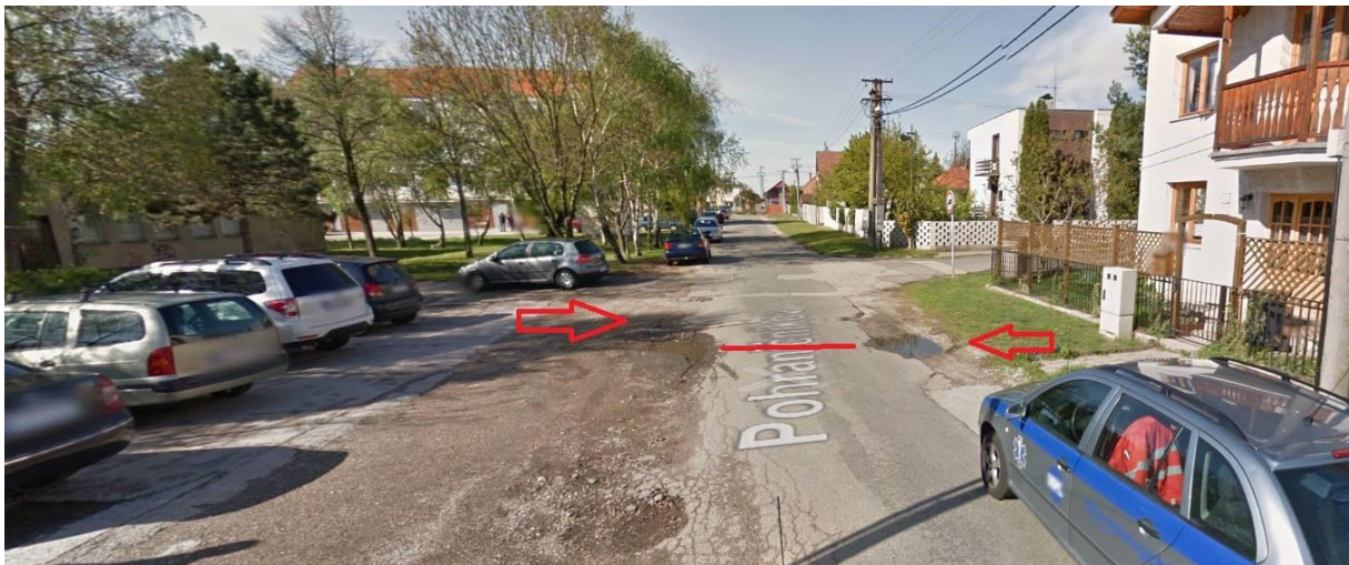
OBRÁZOK 3: STAV CESTY PRED ZDRAVOTNÝM STREDISKOM

Prítomní konštatovali, že v oboch prípadoch ide o miesta, ktoré sa budú v dohľadnej dobe meniť, takže principiálne riešenie bude súčasťou väčších projektov.