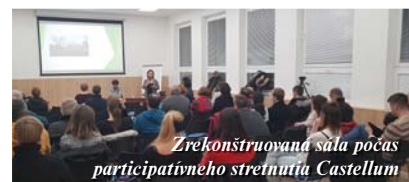
Zrekonštruovaná sála počas participatívneho stretnutia Castellum

Ziskali sme príjemné a dôstojné miesto na uskutočňovanie rôznych kultúrnych, spoločenských a rodinných akcií, ako aj na realizáciu školení, seminárov, prednášok, kurzov, či iných aktivít. K dispozícii sú dve miestnosti - sála a klubovňa. Priestory sály sú vybavené stolmi, stoličkami, dataprojektorom, premietacím plátnom a miestnosť je ozvucená. Do miestnosti sa zmestí max. 80 osôb, závisí od spôsobu usporiadania sály. Klubovňa je možno využívať najmä na záujmovú činnosť - rôzne kurzy, krúžky, školenia pre menší počet ľudí a pod. Do