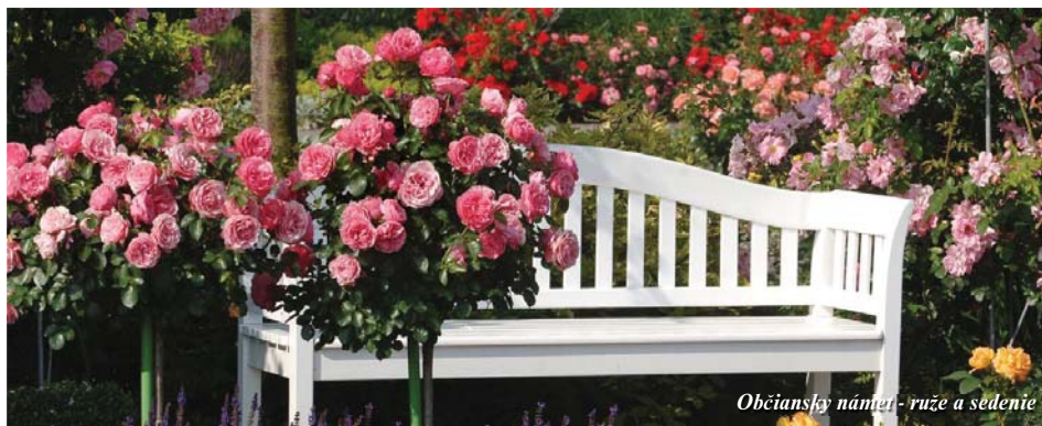
Občiansky námet - ruže a sedenie

O pláne vybudovať nové zdravotné stredisko a spolu s ním nový verejný priestor s bývaním, službami a občianskou vybavenosťou na mieste dnešného dožívajúceho zdravotného strediska a vybudovať tak nové malé centrum Rusoviec, sme Vás informovali v poslednom čísle. Určite ste zaregistrovali, že odvtedy prebehla občianska participácia k tomuto priestoru - o jej výsledkoch vám píšeme dnes.