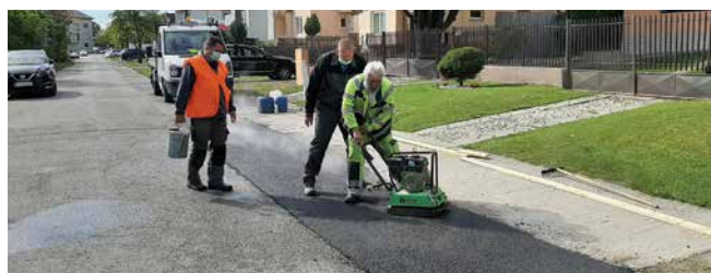
Asfaltovali sme drobné výtky na komunikáciách v správe MČ