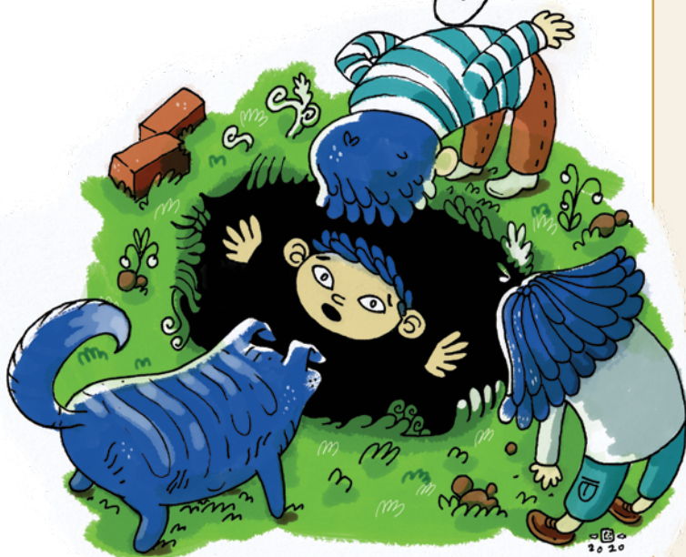
Ilustroval: Filip Horník

„Žena moja! To je úlovok! Sme boháči! Aha, tu je znak Limes Romanus! Hoď mi batoh, všetko tam schovám, nech nás nik nevidí!“