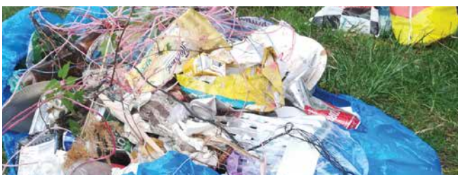
Po podnetoch od občanov zbierame aj odpad pri jazerách a okolí