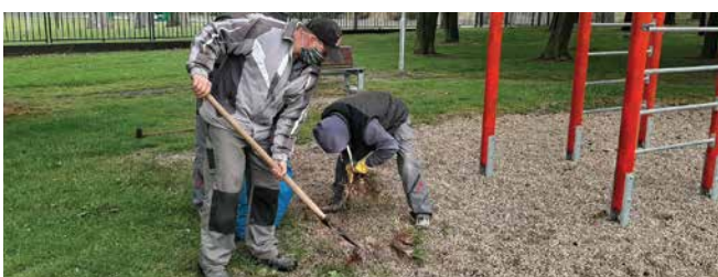
Po rekonštrukcii poškodených herných prvkov na ihrisku pri MFK sme upravili aj okolie