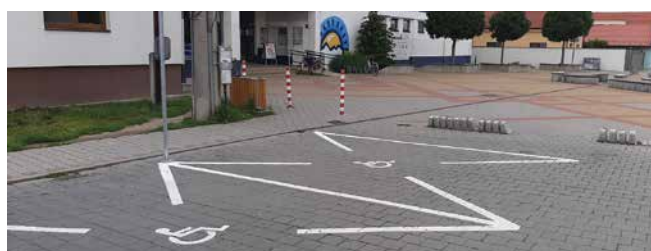
Pred nákupným strediskom sme vytvorili parkovaciu plochu pre invalidov