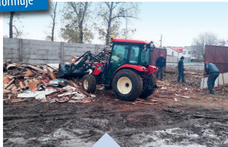
V závere uplynulého roka sme stihli upratať zberný dvor, ktorý bol plný nábytku a drevnej hmoty