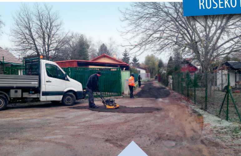
Vyrovňovali sme nerovnosti a výtšky asfaltovou drvinou na spevnenej ceste pre záhradkárov za Colníckou ulicou