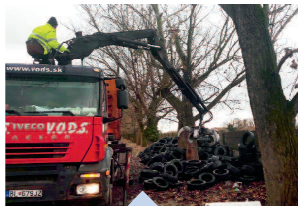
Miestom spätného zberu ojazdených pneumatík je každá spoločnosť, ktorá predáva pneumatiky a prezúva aj bez predaja. Napriek tomu nám neustále vznikajú čierne skládky pri zberných hniezdach a stojiskách kontajnerov v Rusovciach