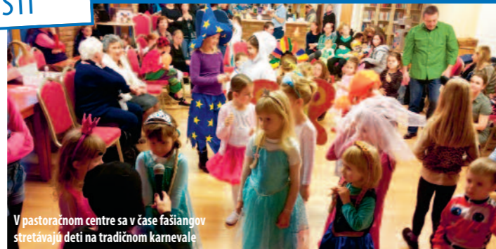
V pastoračnom centre sa v čase fašiangov stretávajú deti na tradičnom karnevale