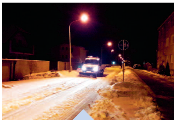
Pri zvýšenej snehovej nádielke nie je možné z kapacitných dôvodov miestneho podniku súčasne odhŕňať naraz všetky cesty, parkoviská, ako ani chodníky. Aj vzhľadom na zložitú situáciu v prvom rade riešime najfrekvencovanejšie miesta a následne odpratávame ostatné zasnežené cesty, plochy a chodníky. Veľakrát čistíme sneh aj z chodníkov, ktoré nie sú v správe mestskej časti Rusovce, a preto prosíme obyvateľov o pochopenie a zároveň o pomoc pri odhŕňaní snehu z chodníkov pred vlastných domov.